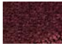
Bourgogne 881 4 m