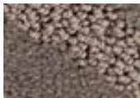
Cendre 771 4 m