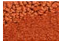
Cayenne 451 4 m