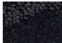
Jais 996 4 m