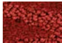
Garance 571 4 m