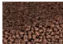
Palissandre 681 4 m