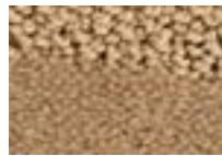
Moka 631 4 m