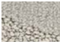
Perle 911 4 m