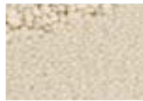
Ivoire 011 4 m