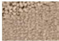
Grès 741 4 m