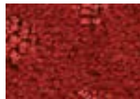
Garance 571 4 m