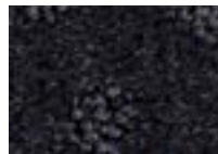
Jais 996 4 m