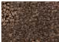
Wengé 691 4 m