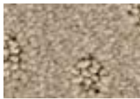
Grès 741 4 m