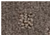
Cendre 771 4 m