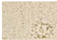
Ivoire 011 4 m