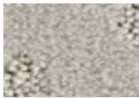
Perle 911 4 m