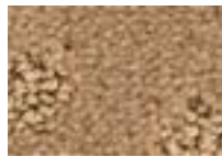
Moka 631 4 m