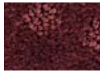
Bourgogne 881 4 m