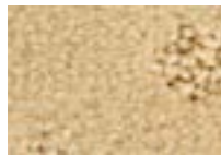
Sable 311 4 m