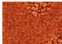
Cayenne 451 4 m