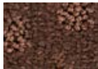
Palissandre 681 4 m